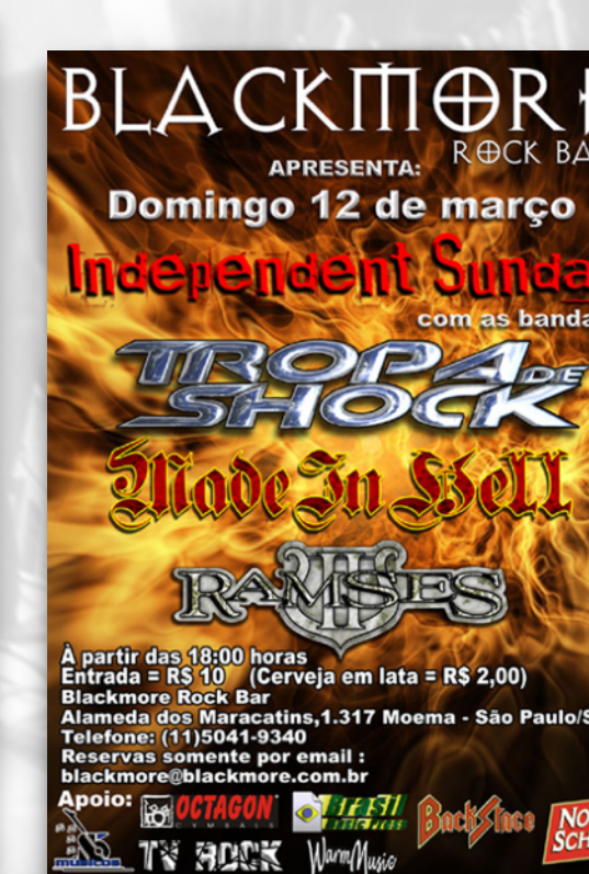
INDEPENDENT SUNDAY BLACKMORE ROCK BAR SÃO PAULO 2006