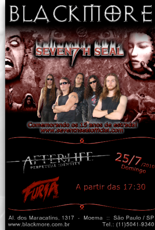
15 YEARS ON THE ROAD BLACKMORE ROCK BAR SÃO PAULO 2010