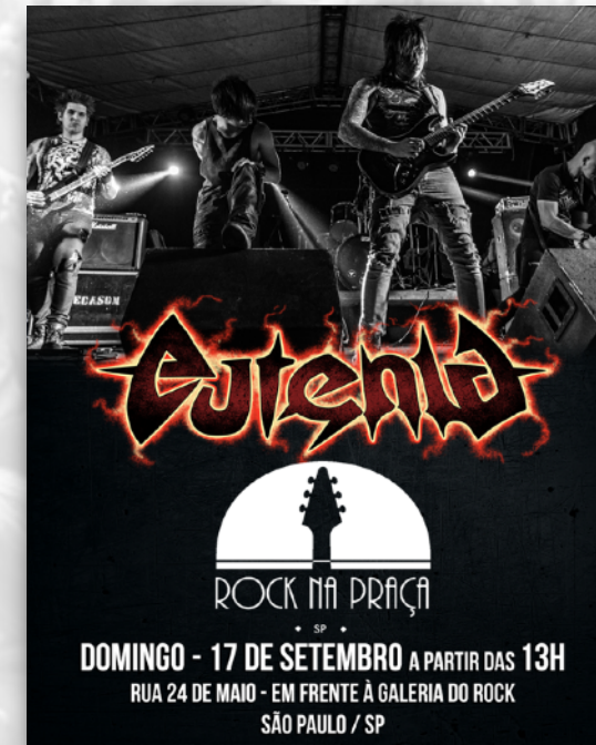
ROCK NA PRAÇA GALERIA DO ROCK SÃO PAULO 2017