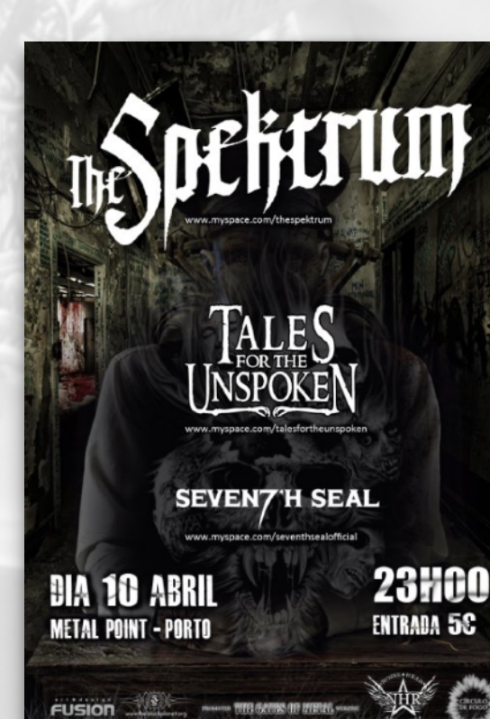
THE SPEKTRUM PORTO PORTUGAL 2010