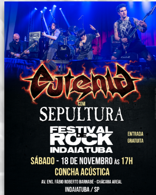
EUTENIA + SEPULTURA PARQUE ECOLÓGICO INDAIATUBA 2017