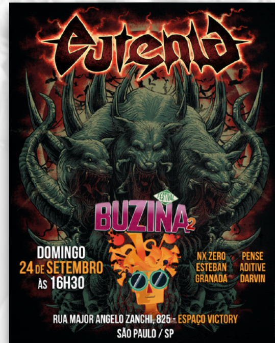
BUZINA FESTIVAL II ESPAÇO VICTORY SÃO PAULO 2017