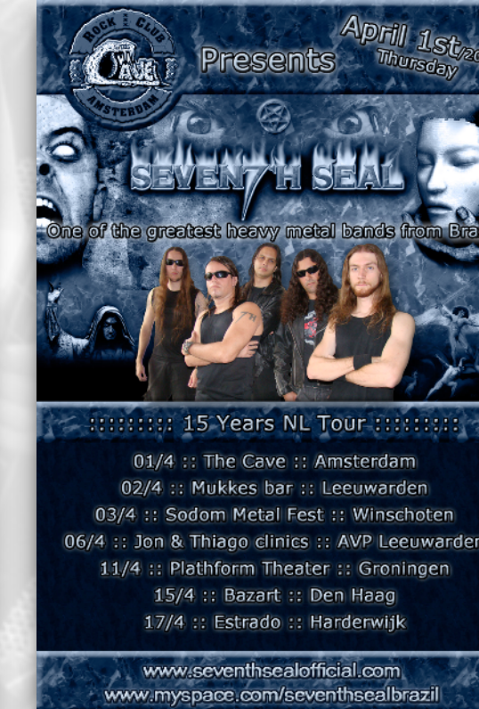
INSANITOUR THE CAVE EUROPE 2010