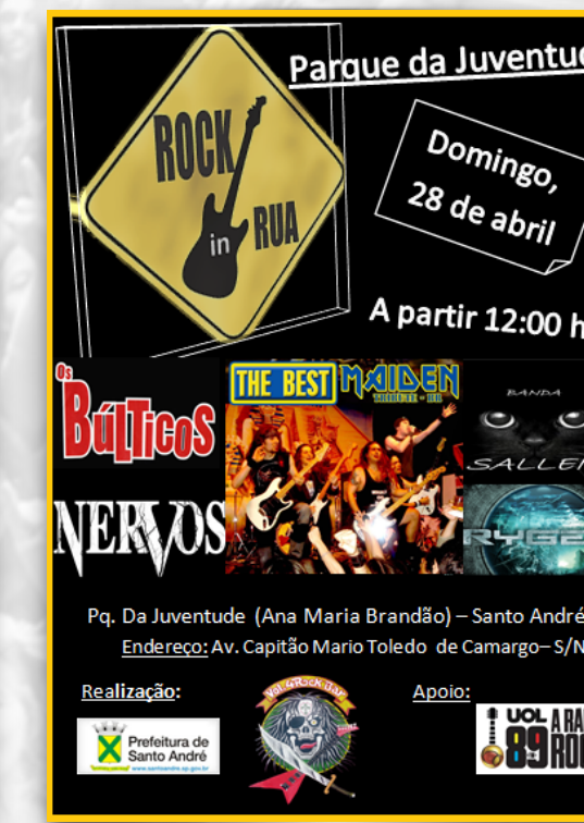
ROCK IN RUA PARQUE DA JUVENTUDE SANTO ANDRÉ 2013