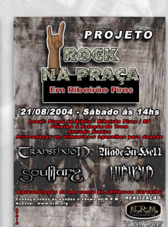
ROCK NA PRAÇA PRAÇA DA BÍBLIA RIBEIRÃO PIRES 2004