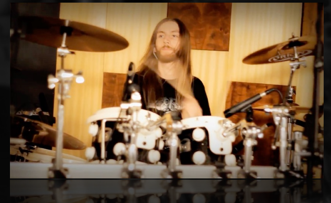
RYGEL | LEAVE ME ALONE