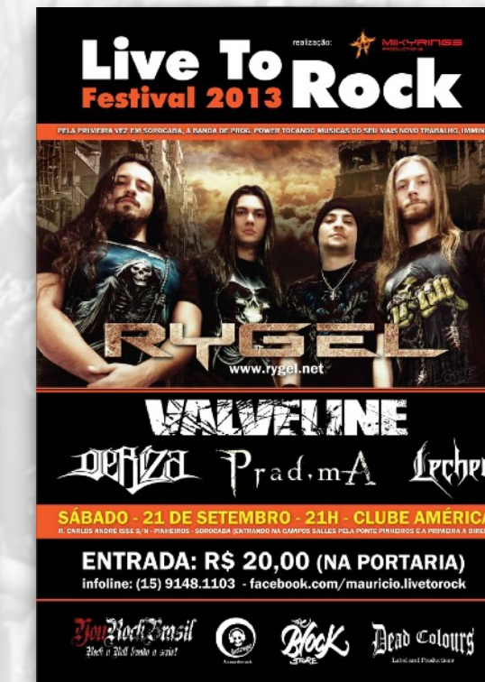
LIVE TO ROCK CLUBE AMÉRICA SOROCABA 2013