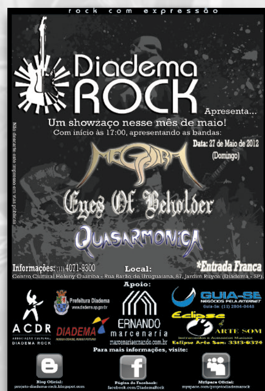
DIADEMA ROCK CENTRO CULTURAL HG ABC PAULISTA 2012