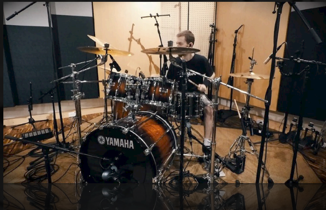
STORM OF DEATH | #1