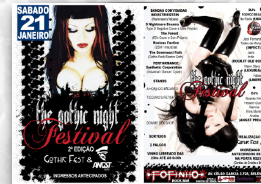
GOthic NIGHT FESTIVAL II FOFINHO ROCK BAR SÃO PAULO 2017