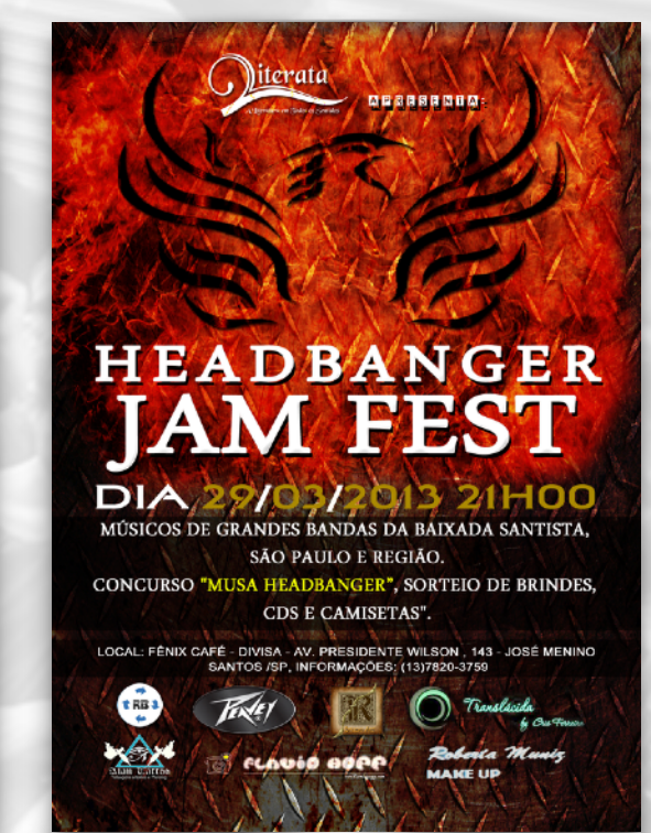
HEADBANGER JAM FEST FÊNIX CAFÉ SANTOS 2013