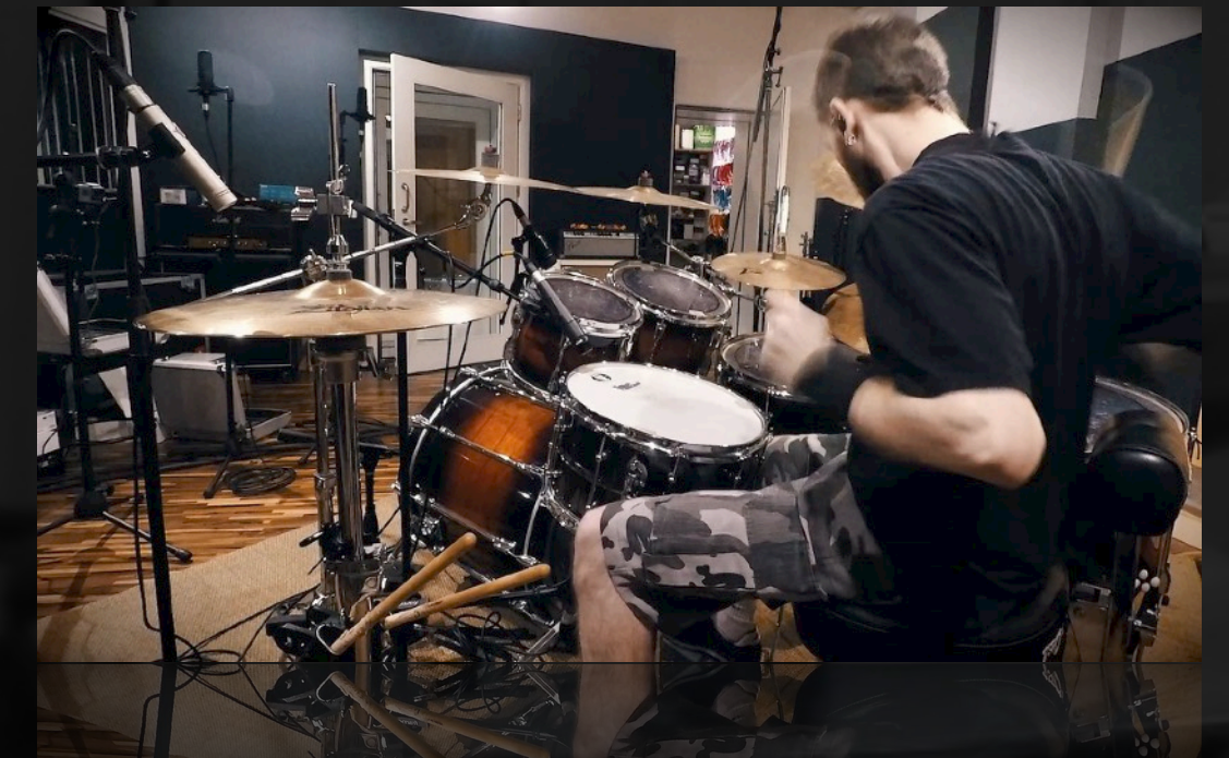
STORM OF DEATH | #3