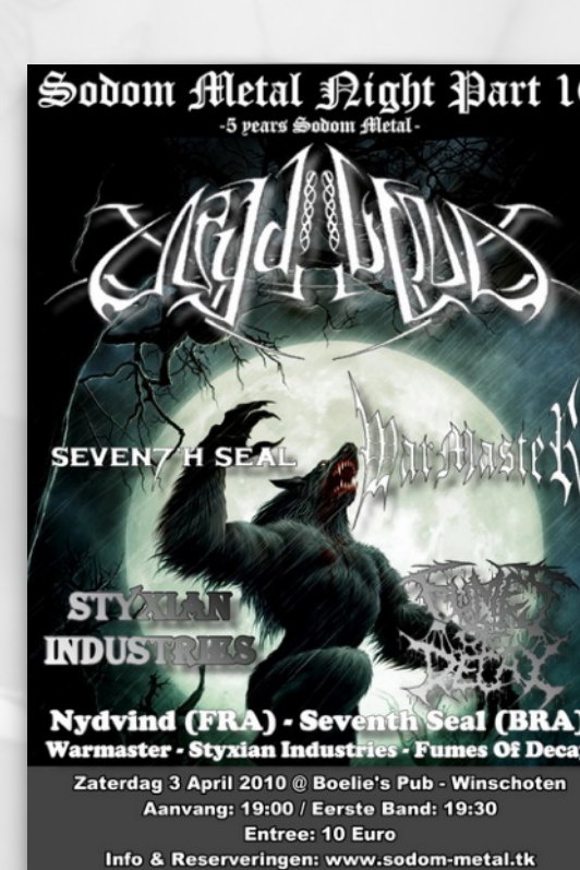
SODOM METAL NIGHT X WINSCHOTEN NETHERLANDS 2010