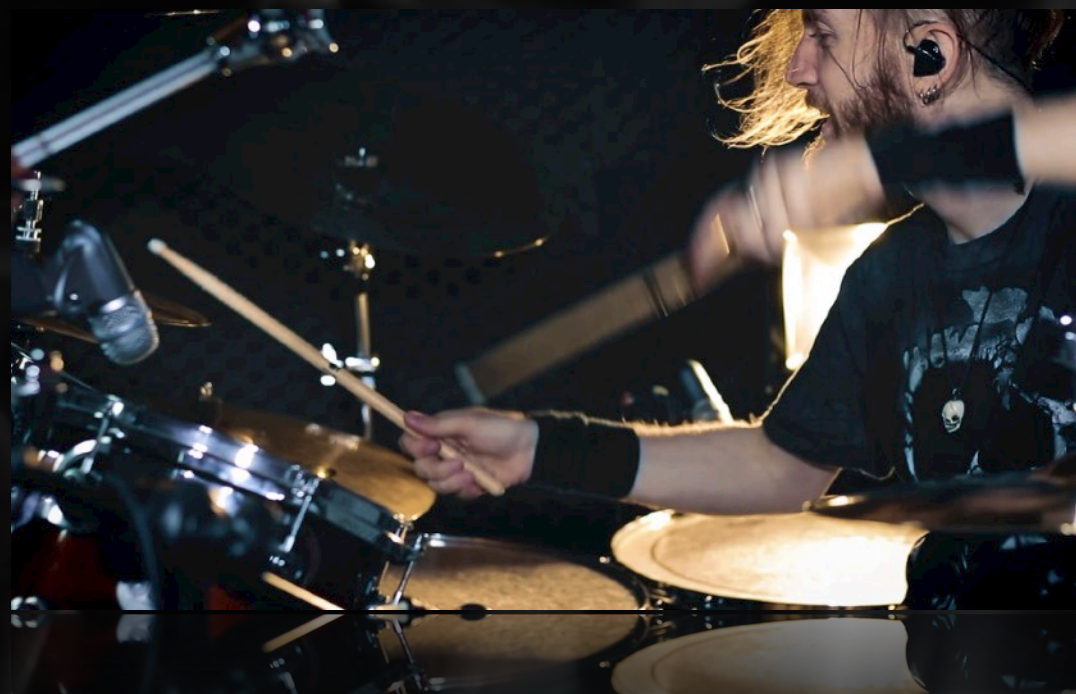
EUTENIA | CÓLERA