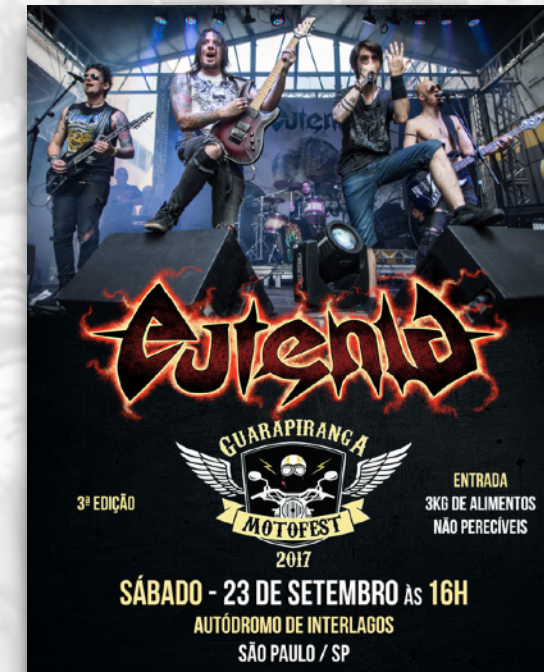
MOTOFEST AUTÓDROMO DE INTERLAGOS SÃO PAULO 2017